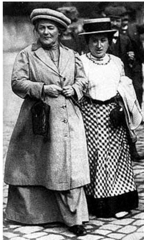
Clara Zetkin y Rosa Luxemburg

Clara Zetkin, maestra, revolucionaria, política feminista y pacifista alemana, nació en Wiederau (Sajonia), el 5 de julio de 1857. Durante el Congreso Constitutivo de la II Internacional, efectuado en París en 1889, Clara Zetkin llamó la atención de sus